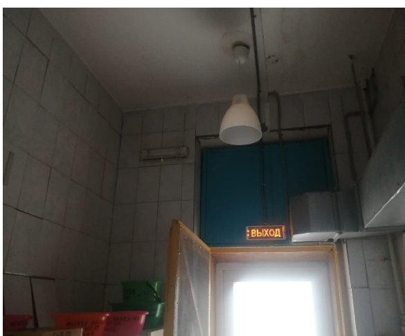
Кладовая сырой продукции