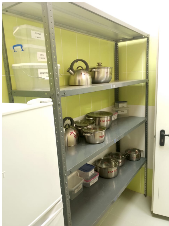
Место хранения тары готовой продукции