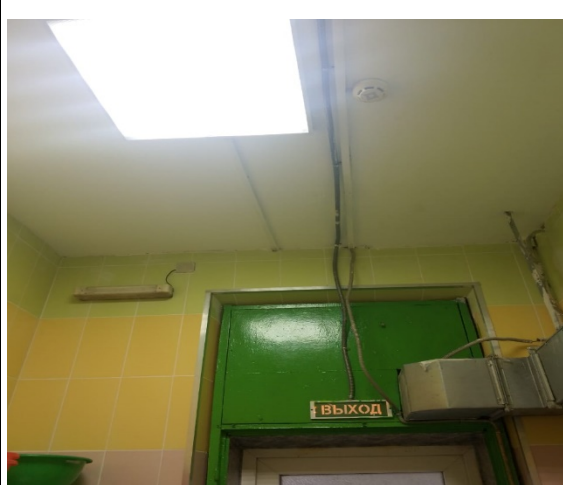
Кладовая сырой продукции