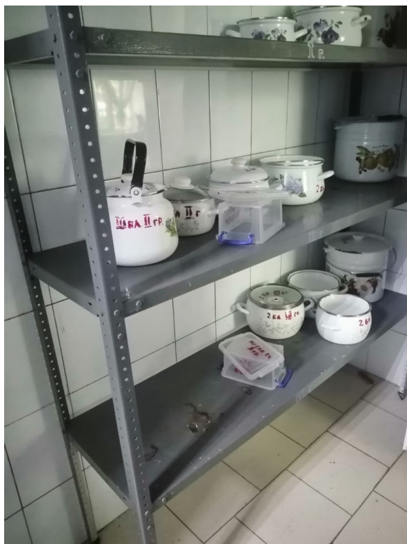
Место хранения тары готовой продукции