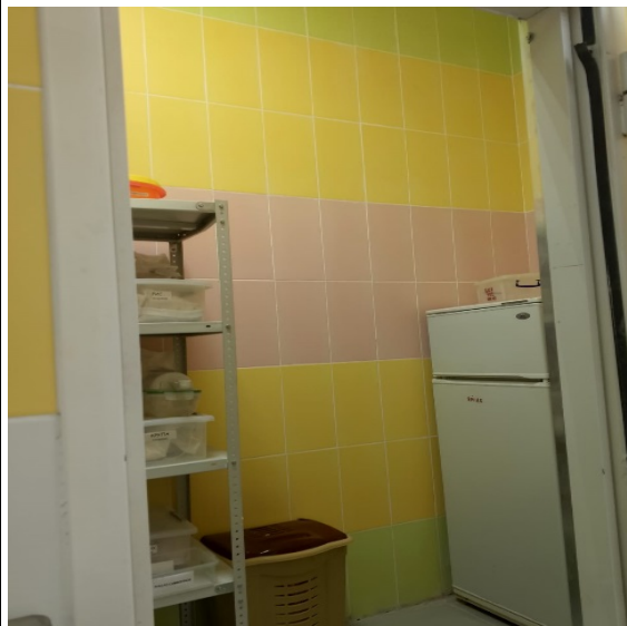
Кладовая сыпучих продуктов